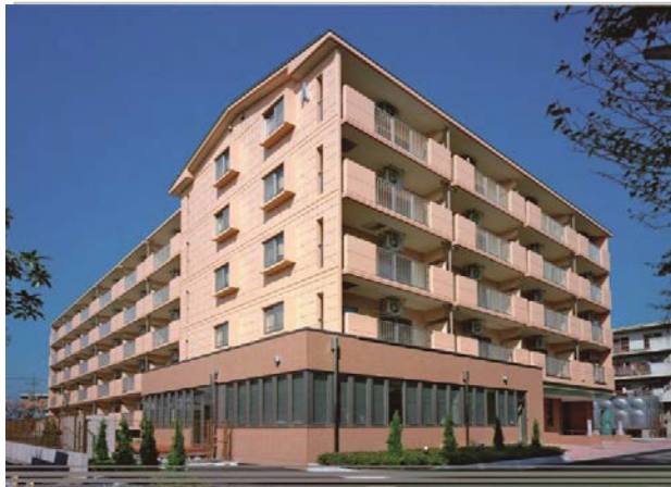
マロニエハイツ陽北A棟