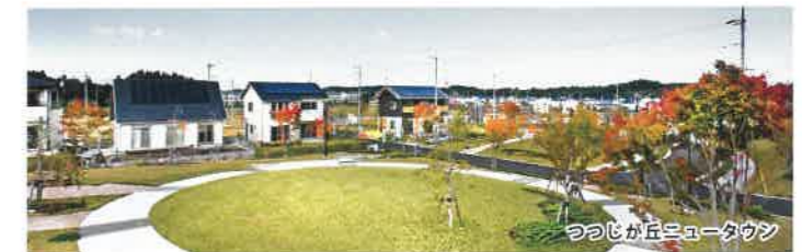
つつじが丘ニュータウン