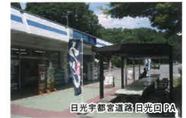
日光宇都宮道路日光回PA