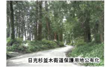
日光杉並木街道保護用地公有化