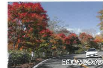
日塩もみぢライン