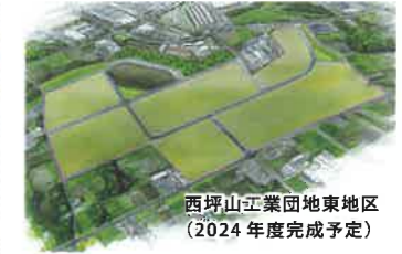
西坪山工業団地東地区 (2024年度完成予定)