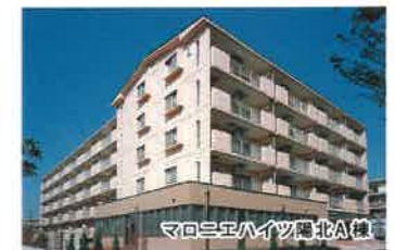
マロニエハイツ陽北A棟