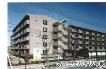
マロニエハイツ今泉