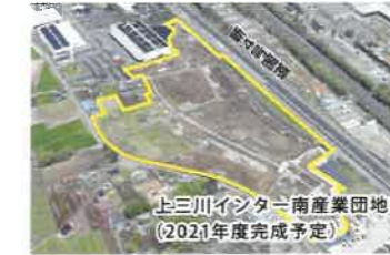
上三川インター南産業団地 (2021年度完成予定)