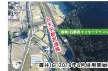
藤井IC(2019年6月供用開始)