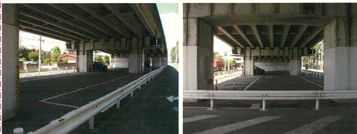
所在地は裏面参照

全面舗装で、雨に濡れずに乗り降りできます。 鶴田駅までの通勤や自宅車庫として御利用下さい。